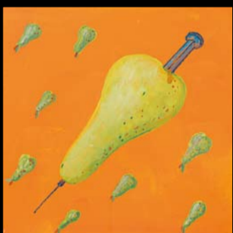
CODICE A SBARRE 2008 ARTE IN SCATOLA 03/06/08 - 03/10/08

(I RAGAZZI DEL LICEO ARTISTICO DI TREVISO INTERPRETANO IL PROGETTO)