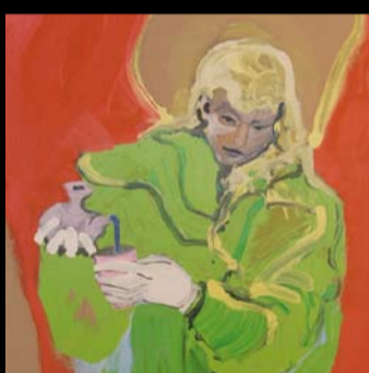
LUDOVICO SARTOR ANGELI 29/03/08 - 22/05/08