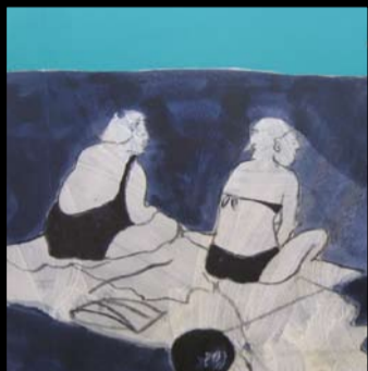
WALTER DAVANZO SPIAGGE 22/09/07 - 22/11/07