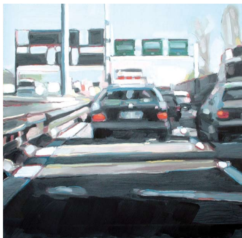
A4, 2008: OLIO SU TELA, 80 X 80 CM