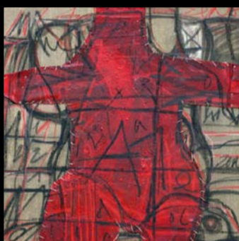
CLAUDIA BUTTIGNOL DOLLS 02/02/08 - 27/03/08