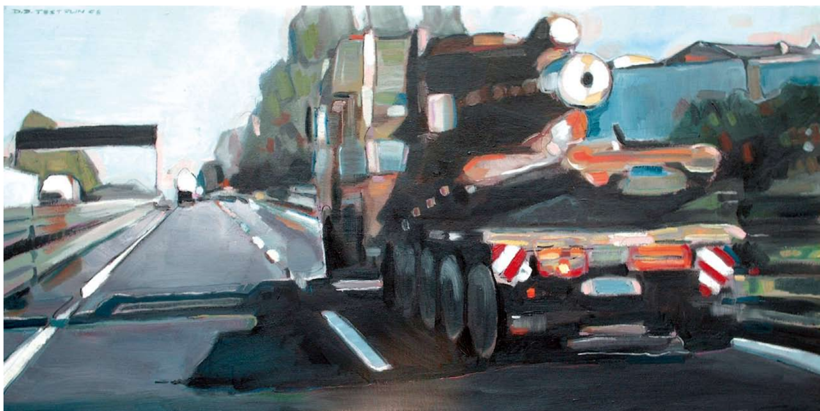
TRASPORTO ECCEZIONALE, 2008: OLIO SU TELA, 60 X 120 CM