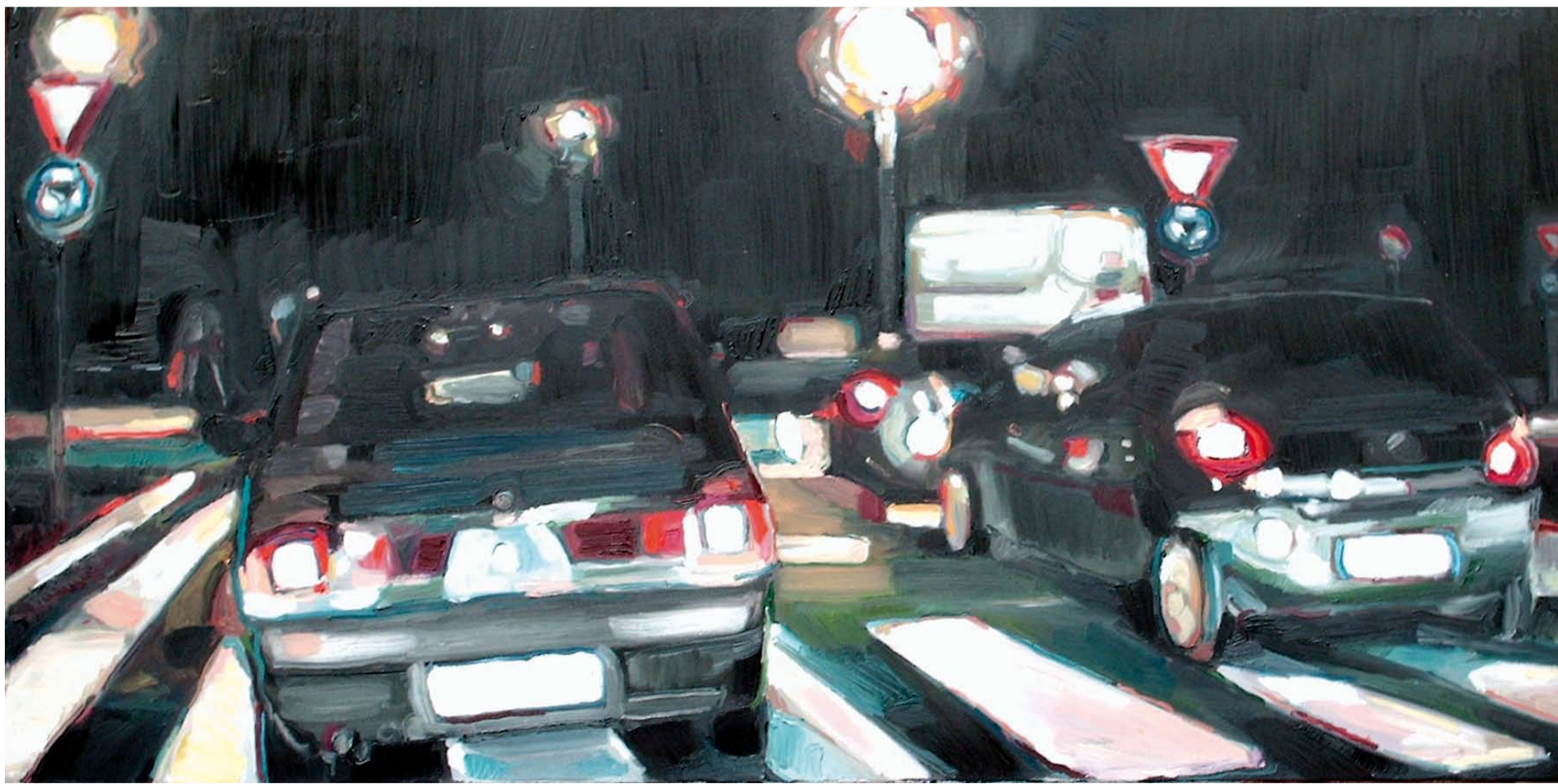
AUTOGRILL, 2007: OLIO SU TELA, 70 X 90 CM