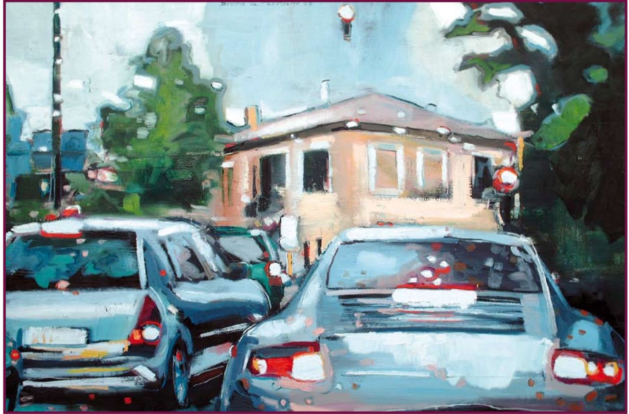
FILA F 911, 2008: OLIO SU TELA, 80 X 120 CM