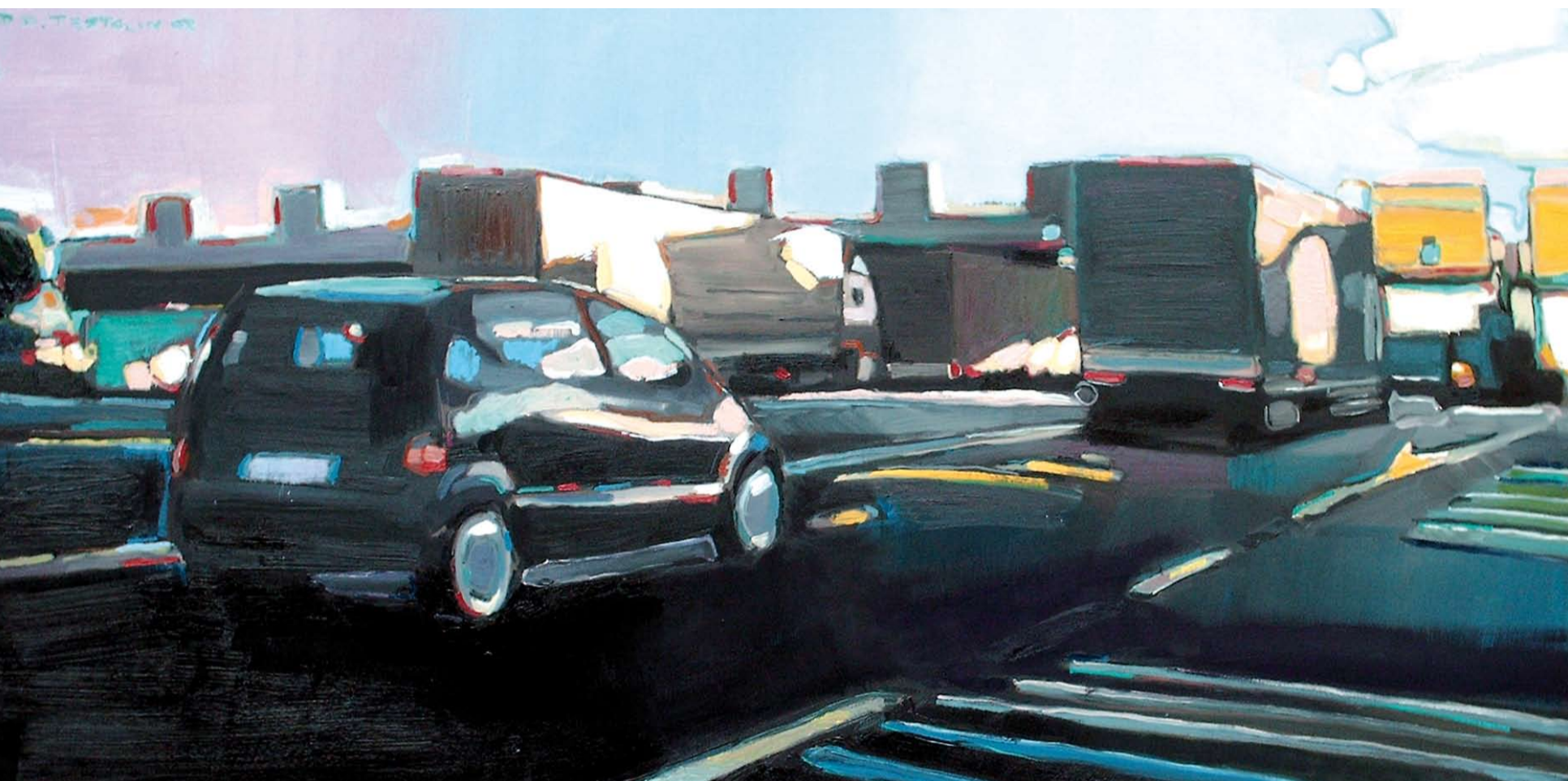
CASELLO, 2008: OLIO SU TELA, 50 X 100 CM