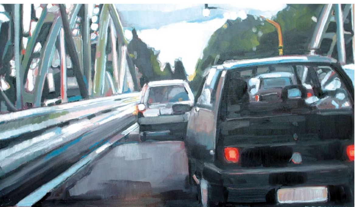
PONTE, 2008: OLIO SU TELA, 70 X 120 CM